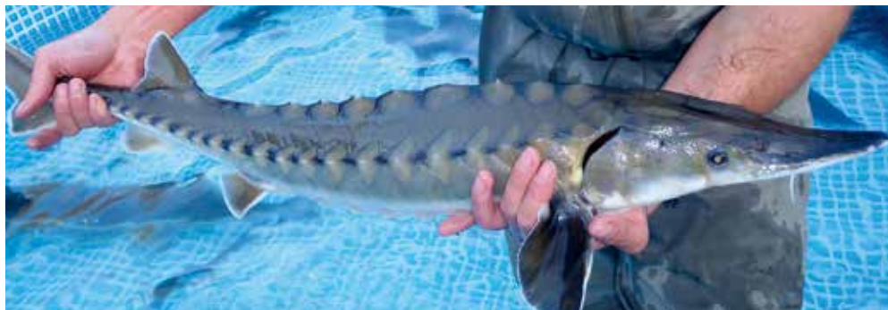
Abb. 8: Atlantischer Stör. Die Art ähnelt äußerlich stark dem Europäischen Stör.

Der Atlantische Stör ( Abb. 8 ) ist an der Ostküste Nordamerikas sowie in der Ostsee heimisch. Er ist erst seit sehr kurzer Zeit in Aquakulturen erhältlich und wurde bisher nur in sehr geringen Mengen als Zierfisch nach Österreich eingeführt.