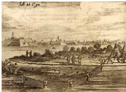
Abb. 1: Fang verschiedener Störarten in der Mittleren Donau. Im Bild links ist ein Fangzaun angedeutet. Weiters ist die Verarbeitung (Einsalzen in Fässern) dargestellt (aus Marsigli, 1726). Rechts: Störfang bei Komárno (aus Hohberg, 1682)