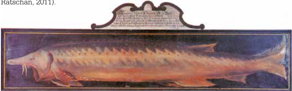
Abb. 5: Hausen aus der Salzach bei Tittmoning (1617). Ölgemälde im Jagdzimmer von Schloss Hellbrunn bei Salzburg.

Hinweise auf einen möglichen Hausenfang im Inn bei Reichersberg (vermutlich um 1880) können nicht überprüft werden, da das Belegexemplar im dortigen Stift nicht mehr vorhanden ist. Der Hausen stieg jedoch nachweislich in die Salzach auf, was durch einen Einzelfang (6. Februar 1617 bei Tittmoning, Hausen mit ca. 3,5 m Länge und 133 kg) belegt ist (Abb. 5). Folglich kam er auch im Unteren Inn sporadisch vor (Schmall & Ratschan, 2011).