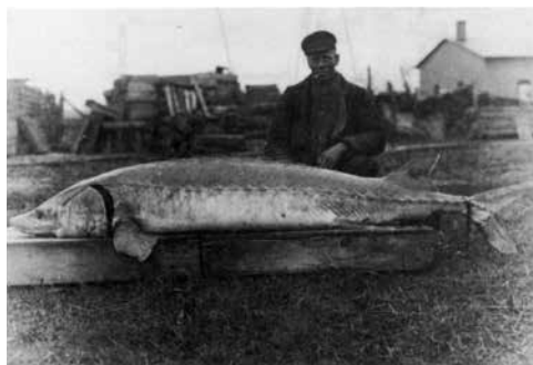
Abb. 4: Vermeintlicher Hausenfang bei Straubing – in Wirklichkeit ein Atlantischer Stör von der Samlandküste (Ostsee)

Konkrete Hinweise auf Hausenfänge in der Bayerischen Donau sind für die 2. Hälfte des 19. Jahrhunderts ebenfalls rar. Während der Hausen bei Passau in der 1. Hälfte des 19. Jahrhunderts nach Wagner (1846) noch öfters gefangen wurde (konkrete Fangnachweise werden allerdings nicht genannt), liegt für die Jahrhundertwende nur eine vage Angabe über einen »vor wenigen Jahren« getätigten Fang aus dieser Gegend vor (Vogt & Hofer, 1909). Bislang konnten dazu jedoch weder Presseberichte noch sonstige Hinweise