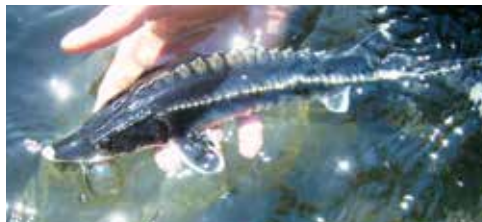
Abb. 7: 0+ Hausen des Wolgastammes aus einer Fischzucht in Deutschland.

Das aktuelle Vorkommen beschränkt sich auf die Untere Donau, vom Delta bis zu den Djerdap-Dämmen am Eisernen Tor. Die letzten beiden bekannten Hausenfänge flussauf der Kraftwerke am Eisernen Tor stammen aus der Ungarischen Donau (1972 und 1987 [Abb. 6]), wobei letzteres Individuum beide Dämme vermutlich über die Schiffsschleusen überwand (Guti, 2008). Generell werden in der Donau eine Herbst- und eine Frühjahrsform des Hausen unterschieden (z. B. Holčík, 1989; Khodorevskaya et al., 2009; Friedrich, 2013). Während die Herbstform im Herbst in die Flüsse wandert, dort überwintert und im Frühjahr nach einer