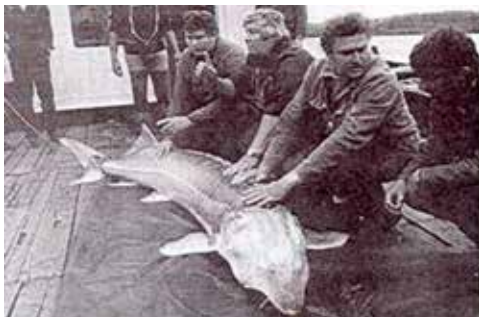
Abb. 6: Hausen, gefangen in der Nähe von Paks, Ungarn im Jahr 1987. Es handelt sich um das letzte große dokumentierte Exemplar in der Mittleren Donau nach dem Bau der Kraftwerke am Eisernen Tor.

Hausen, Huso huso L. 1758. « Die Angaben zum Hausen beruhen jedoch auf reinen Mutmaßungen und sind nicht belegbar, weshalb ein Vorkommen in der Steirischen Mur und erst Recht in der Raab aus heutiger Sicht auszuschließen ist (Woschitz, 2006).